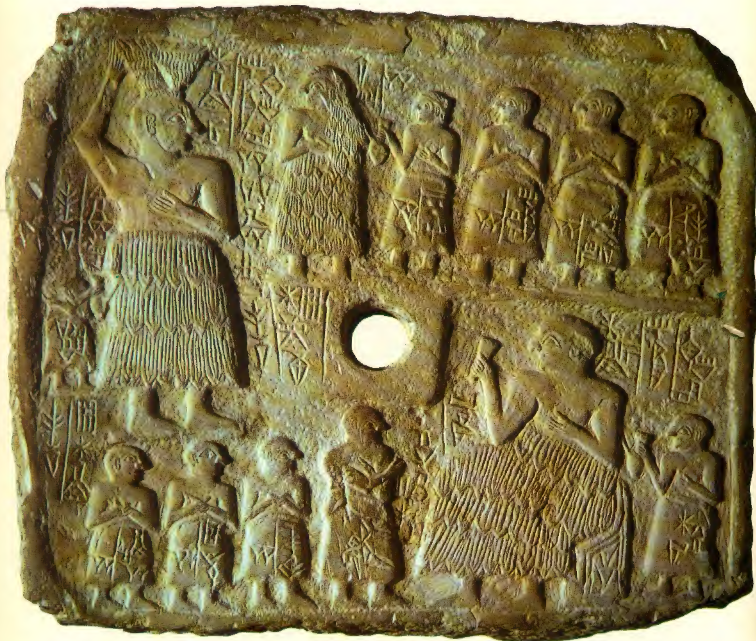
Estela perforada de mediados del III milenio que representa al rey de Lagash, Ur-ninsum, cumpliendo algunas funciones reales (Museo del Louvre, París). Arriba, el rey, acompañado de la reina y de sus hijos, lleva un cesto de ladrillos en la cabeza para inaugurar las obras de un templo. Abajo, bebe en una copa en presencia de la corte. Obsérvese que todos los hombres llevan la cabeza rapada, señal inequívoca de que son sumerios.

el dragón del abismo”. Después de explicar la construcción y decoración del templo, vienen los sacrificios de su dedicación, largos rituales de las hecatombes, a los que sigue el banquete ceremonial. El monarca, todavía vestido con su falda prehistórica de hoja de caña, bebe acompañado de sus hijos al son del arpa del músico cantor del templo. Probablemente las endechas litúrgicas de los sumerios serían como las de los actuales cantores de la sinagoga. La larguísima inscripción de Gudea continúa describiendo como el dios pasó al nuevo santuario igual que “un torbellino de viento”; los otros dioses, sus compañeros y ayudantes, entraron con él; se hace, por ejemplo, mención del dios que conduce el carro, del dios pastor, del dios músico, del inspector de